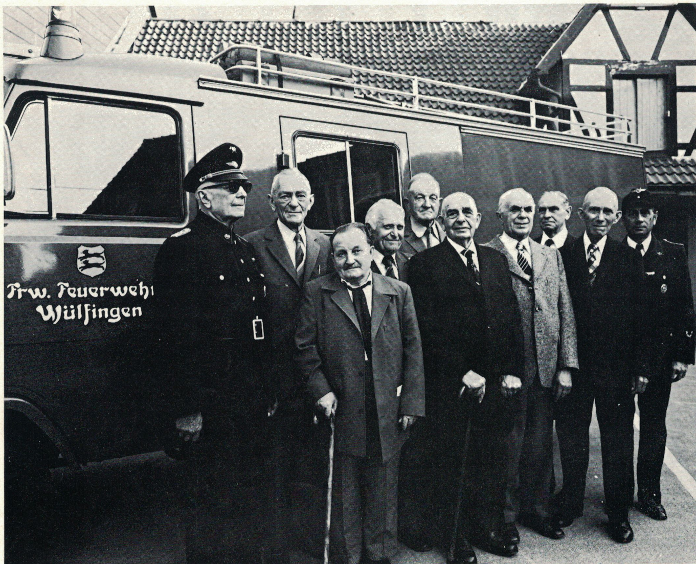
Die Ehrenmitglieder der Wehr im Jubiläumsjahr