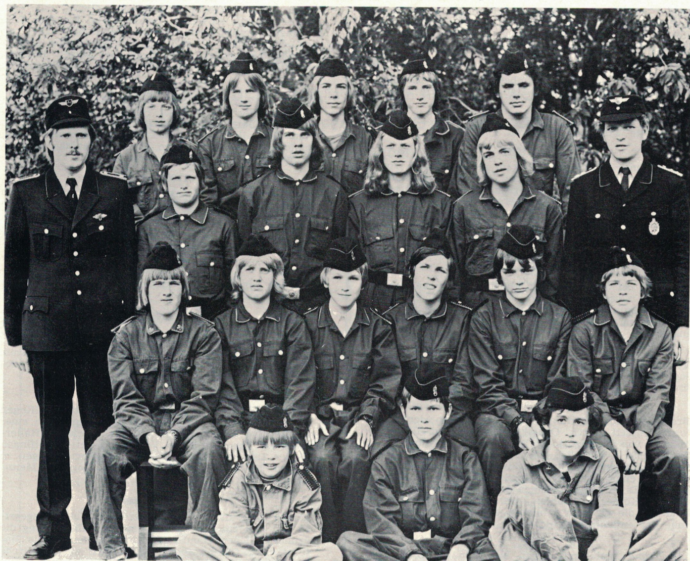
JUGENDWEHR der Freiwilligen Feuerwehr Wülfingen 1976