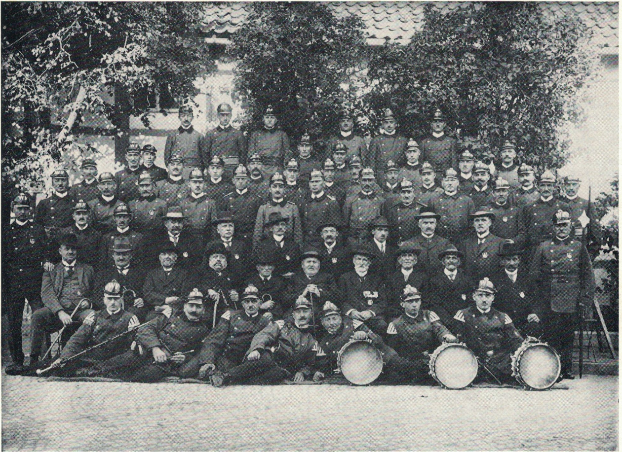
Die Wehr beim 50jährigen Jubiläum 1926

Dreiteilung des Löschangriffs mit der Gruppeneinteilung durchgeführt.