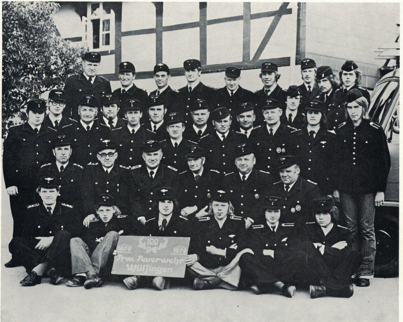
... und beim 100jährigen Bestehen 1976

Adensen. Sieben Einwohner von Adensen fanden dabei den Tod.