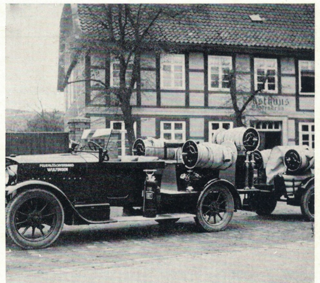
1. Löschfahrzeug 1935

Feier des 50jährigen Jubiläums der Wehr unter starker Beteiligung der Gemeinde durch ein Feuerwehrfest. An Vorführungen fanden eine Löschübung mit